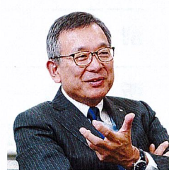
パネリスト Jリーグ 村井 満 様 Jリーグ 第5代チエアマン/名誉会員 日本バドミントン協会 会長 一般社団法人歩行ケア協会 理事 一般社団法人RainboW Walking 理事長